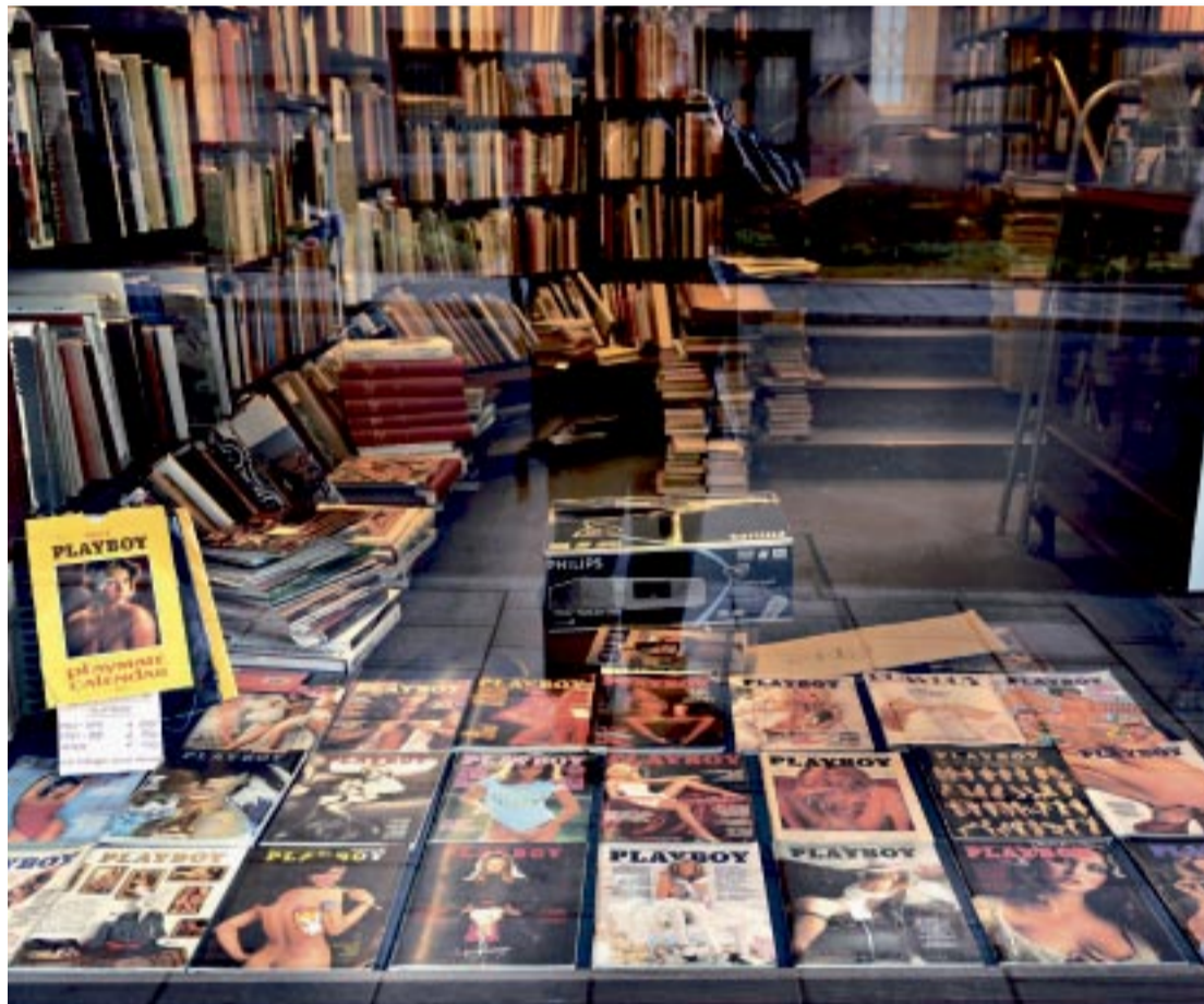
ET KRISETEGN? Ikke nok med at «kvinnemagasin» Dagbladet anmelder pornofilm - ærverdige Norlis antikvariater i Oslo har flyttet herrebladene fra under disken og ut i vinduet.