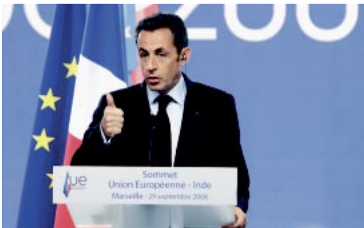
MINORITET. Det er vanskelig å se hvem som er i minoritet om ikke Nicolas Sarkozy er det.

– «Drageløperen»? – Den har jeg selvfølgelig fått servert, men det var for mange vanskelige navn.